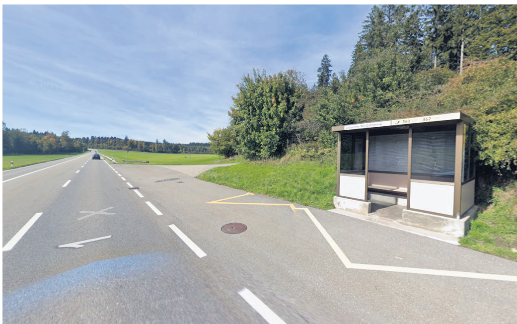
Aujourd'hui, sur les 2300 arrêts de bus concernés dans le canton de Vaud, seuls 9% sont conformes à la LHand.

Quelque 400 arrêts de bus sont situés sur les routes cantonales en dehors des localités, dont 30 sont conformes. Afin d'intervenir efficacement, des critères ont permis d'effectuer une priorisation, comme le nombre de montées par jour aux arrêts et leur proximité avec des établis-